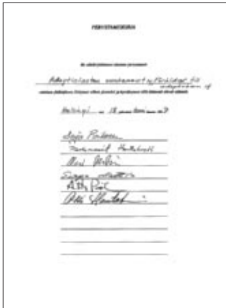
Adoptioperheet ry:n perustamiskirja

Vaikka yhdistyksen tavoitteena oli alusta alkaen palvella koko maan adoptiovanhempien, kaikki ensimmäisen hallituksen jäsenet olivat pääkaupunkiseudulta. Sen sijaan jo alusta asti hallituksessa on ollut maamme kahden tai kaikkien kolmen adoptiopalvelun kautta lapsensa saaneita. Myös eri maat olivat edustettuina: lapsia oli kotimaasta, Kolumbiasta ja Venäjältä. Yksi hallituksen jäsen odotti ensimmäistä adoptiolastaan.