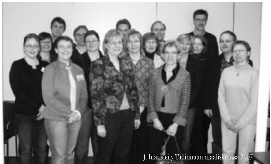
Juhlaristeily Tallinnaan maaliskuussa 2007

Adoptiolasten erityisyys alkoi tulla esiin, kun kansainväliset adoptiot yleistyivät vuodesta 1985 alkaen uuden adoptiolain voimaantultua. Vielä 1990-luvun alussa Suomessa ei ollut mitään erityispalveluja adoptioperheille. Terveystuolto, päiväkotit ja koulu eivät tunteneet adoptiolasten erityiskysymyksiä, ja vanhemmat joutuivat selvittämään hyvin paljon asioita itse.