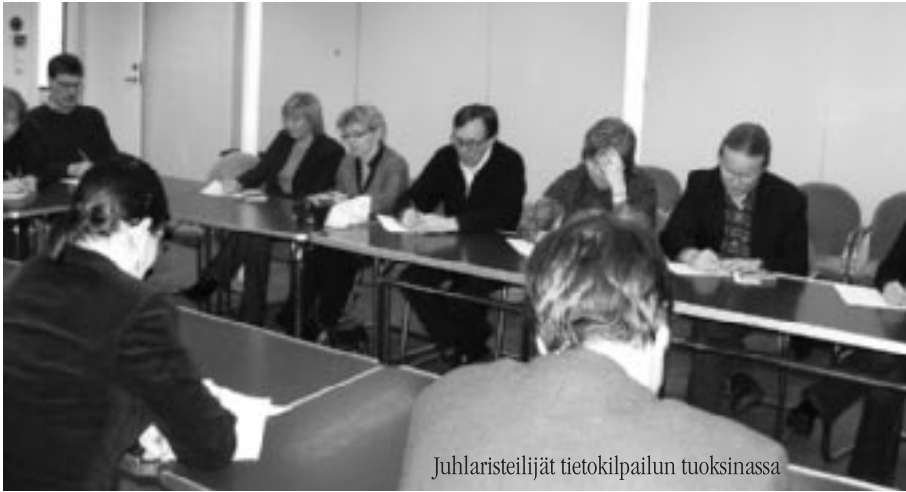
Juhlaristeilijät tietokilpailun tuoksinassa

Ulkomailta adoptoiminen lähti Suomessa käyntiin suurelta osin Ruotsin vaikutuksesta. Ensimmäiset adoptioperheet olivat ruotsinkielisiä tai heillä oli muuten kontakteja Ruotsiin. He pystyivät kielitaitonsa ansiosta saamaan tukea kasvattamiselleen ruotsalaisten kokemuksista.